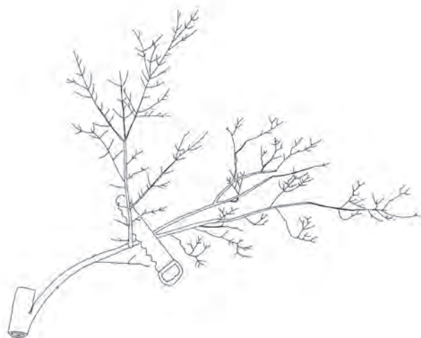
Figura 1.- Eliminación de estructuras envejecidas antes que actuar sobre ejes vigorosos, entre estos los chupones.